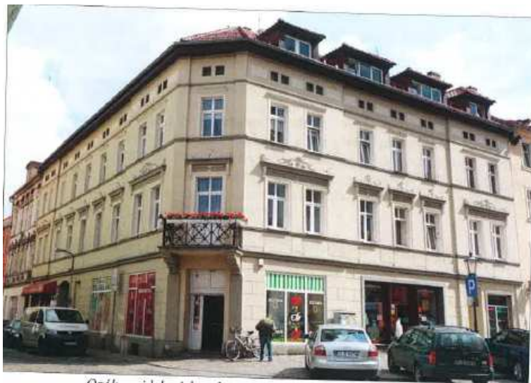
Ogólny widok wielorodzinnego budynku przy ulicy Mikołaja 1.

na sprzedaż lokalu mieszkalnego Nr 2, znajdującego się w budynku położonym w Lubaniu przy ul. Mikołaja 1 (JG1L/00028087/5) wraz z udziałem we współwłasności nieruchomości gruntowej (działka nr 28/1, AM 3, Obręb III o powierzchni 442 m 2 , JG1L/00020779/7)